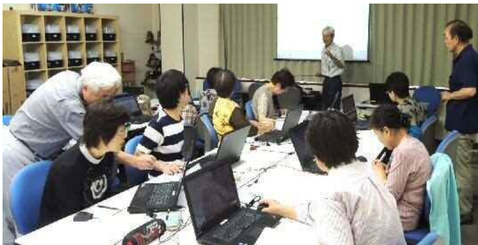
パソコン塾の様子 (NPO法人湖南ネットしが)