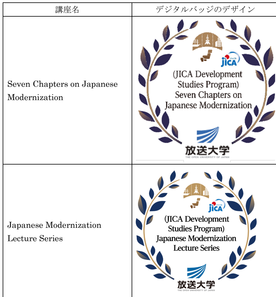
別図 デジタルバッジのデザイン (第6条関係)