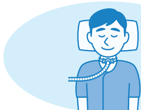
気管カニューレの交換