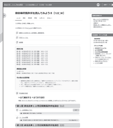
ライブWeb授業システムの画面イメージ