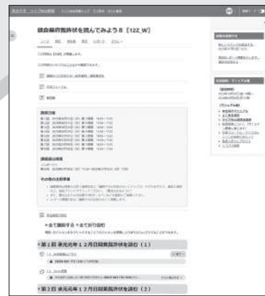
ライブWeb 授業システムの画面イメージ

ライブWeb 授業専用の【学習管理システム (LMS)】にアクセスして受講します。出席登録から、Zoom 授業、レポート提出まで、学習のすべて ※2 が専用システム上で完結します。