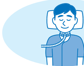
気管カニューレの交換