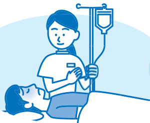
脱水症状に対する輸液による補正