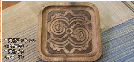
三屋谷アットゥシ (貝塚遺跡) / 三屋谷イタ (貝塚 寺)